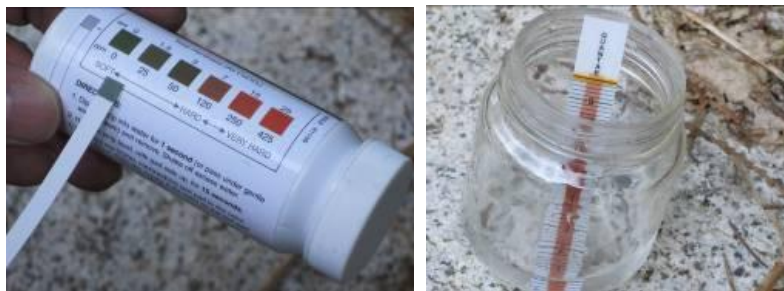
Figure 1. Les bandelettes réactives utilisées pour mesurer les propriétés de l'eau réagissent en changeant de couleur; on les compare ensuite à une échelle de couleurs (la photo de gauche montre la mesure de la dureté totale). La mesure du

La corrosion peut être un phénomène électrochimique. Une faible résistivité électrique et de grandes quantités de sels solubles indiquent généralement un fort potentiel de corrosion. Certains paramètres faciles à mesurer, comme le pH et la dureté de l'eau, peuvent aider les concepteurs et les planificateurs à choisir le revêtement de ponceau qui convient le mieux à un site donné. Il y a une corrélation entre la résistivité et les sels solubles. C'est pourquoi on déduit la résistivité en mesurant la dureté de l'eau et de la présence de chlorures. La dureté est un indicateur de la quantité d'ions de carbonate de calcium ( \text{CaCO}_3 ) dissous dans l'eau, qui peut avoir un effet tampon sur les impacts d'apports d'acide par l'eau de pluie ou l'altération du matériau d'origine. L'eau dure qui contient beaucoup de \text{CaCO}_3 neutralise l'acidité et forme une couche protectrice sur la surface du ponceau. Par ailleurs, une bactérie anaérobie sulfatoréductrice qu'on trouve couramment dans l'eau naturellement douce peut influencer la corrosion de l'acier galvanisé (ce sujet n'est pas abordé dans la présente note). Les chlorures des sels de déglacage et certains abat-poussières sont des ions très solubles qui contribuent à la faible résistivité et favorisent la corrosion de l'acier non protégé. Le personnel terrain peut prendre trois mesures simples pour déterminer les matériaux qui conviennent le mieux au site (figure 1).